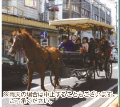
※雨天の場合は中止することもございます。ご了承ください。